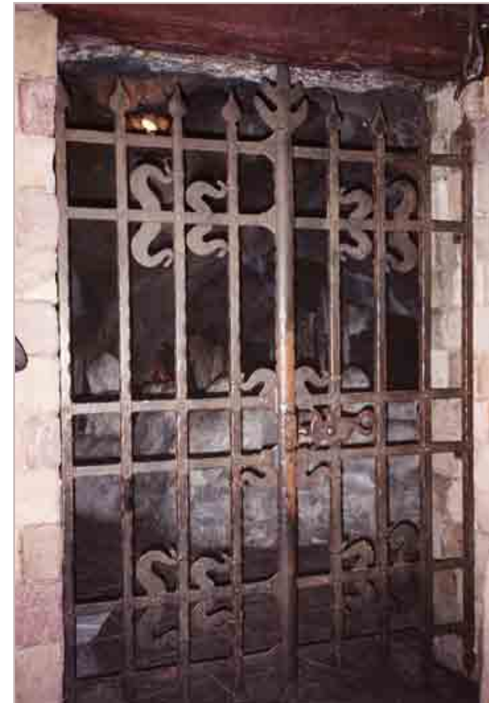
Inferriata prigione Castello Grill Castle Prison Enrejado prisión Castillo Grille prison Château