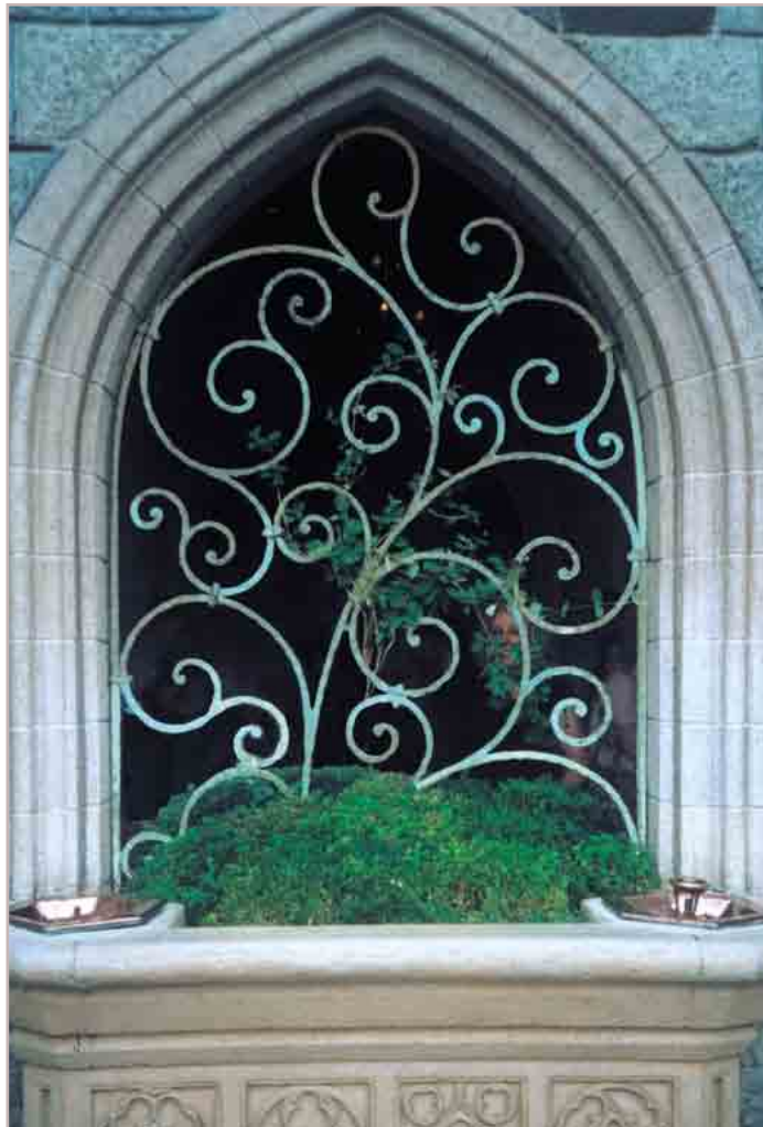
Griglia entrata Castello Grill Castle entrance Reja entrada Castillo Grille entrée Château