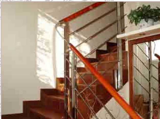
Dettaglio scala interna Détail indoor staircase Detalle de escalera interior Détail escalier intérieur