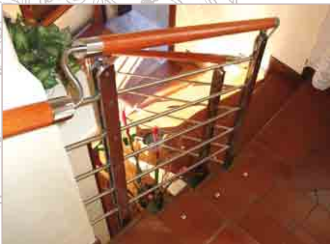
Dettaglio scala interna Détail indoor staircase Detalle escalera interior Détail escalier intérieur