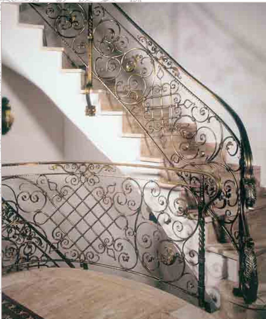
Vista di parapetti e rampa scala interna Vista de barandillas y rampa escalera interior